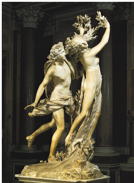
Apolo y Dafne (Bernini)

Bernini, que es el autor más representativo, con obras cargadas de movimiento y expresividad. Destacan obras como el Éxtasis de Santa Teresa de Jesús (1647), con una gran carga de teatralidad; Apolo y Dafne (1622-1625), gran tensión muscular y expresiva, capta el momento en que es perseguida por Apolo y ella se transforma en árbol; David (1624); Rapto de Proserpina (1621); Busto de Constanza Buonarelli (1635); Busto del Cardenal Richelieu (1640); Mausoleos o sepulcros de Urbano VIII y Alejandro VII; Daniel y el León (1650), etc.